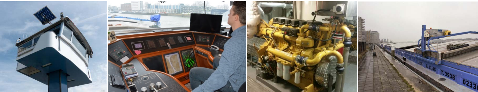
Från vänster; pråmfartygens hög- och sänkbara styrhytt (som klarar lägre brohöjder), dess avancerade bryggutrustning, pråmfartygets lastbilmotor och bulkpråmen som utnyttjar enklare kajlägen centralt i urbana miljöer. Pråmfartygen samspelar med samhället på samma sätt som lastbilen och utgör en länk mellan trafikslagen.

Pråmtrafik ger möjlighet att lyfta stora mängder gods från land till sjö i city- och regionlogistiken och bidrar därmed med motsvarande fördelar för samhälle och varuägare. I tillägg kan den större kushamnen flytta terminaler längre in i landet och därmed minska belastning på landinfrastrukturen runt själva hamnområdet. Pråmtrafiken blir länkar mellan trafikslagen.