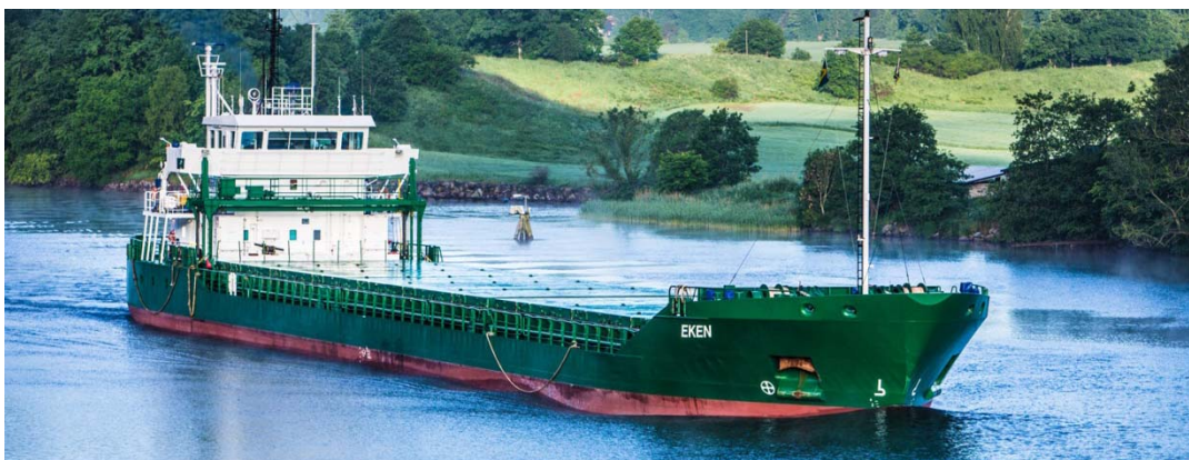
MS Eken, en av Thunbolagens torrlastare i Vänermax-storlek (max 89 m långa och 13,4 m breda), är ett exempel på den småskaliga IMO-sjöfarten. Fartyget med 4 800 dwt är anpassat för slussarna i Trollhättan.