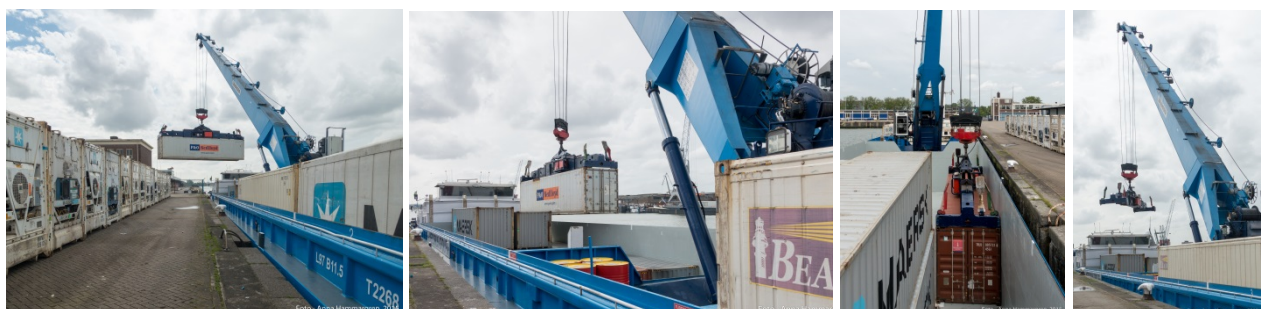
Vissa pråmar är självlastare. Ovan en containerpråm som själv lastar sin containerlast som står uppställd på ett enklare kajutrymme.